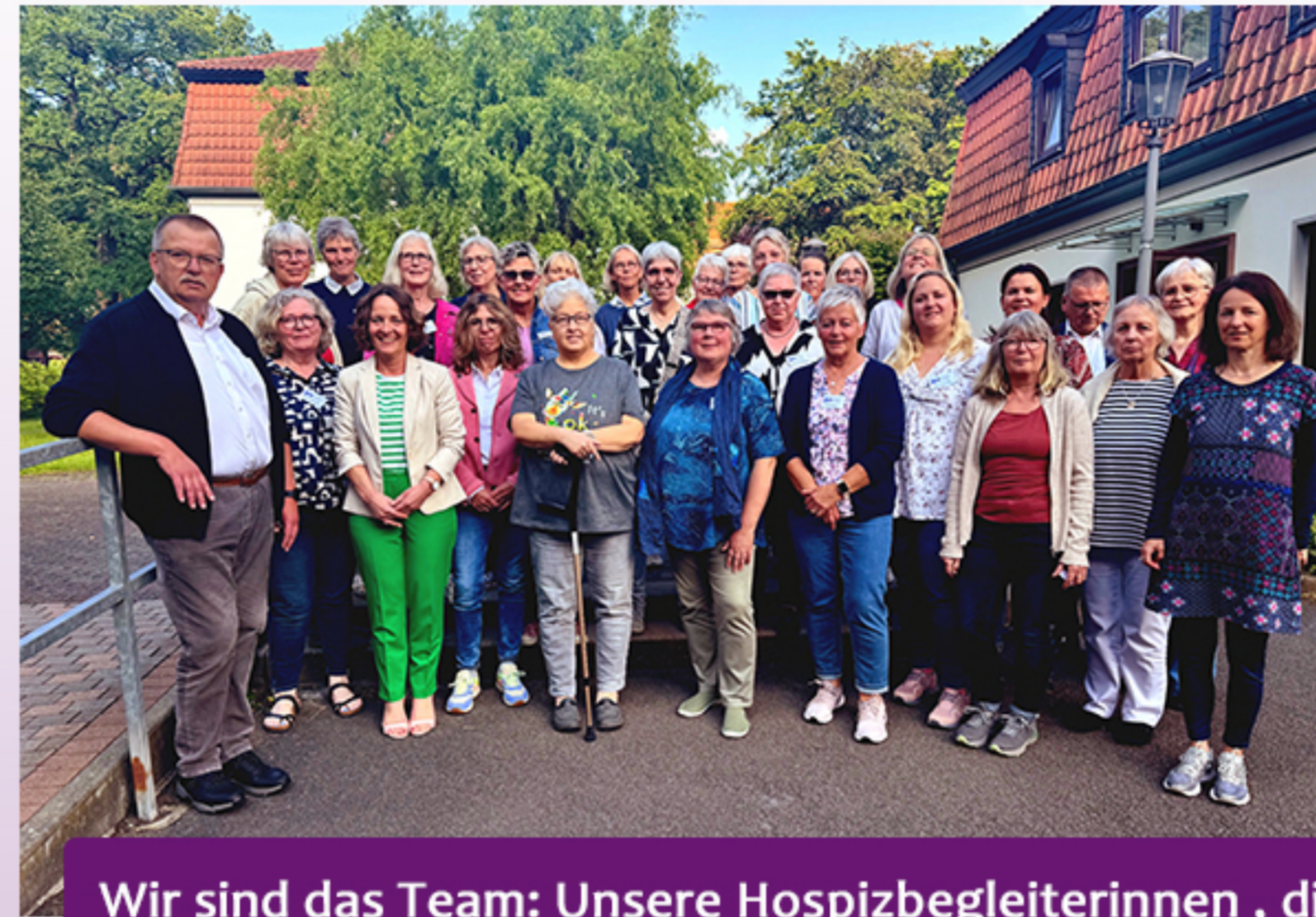
Wir sind das Team: Unsere Hospizbegleiterinnen, die Koordinatorinnen und die Träger des Hospizdienstes Bad Arolsen